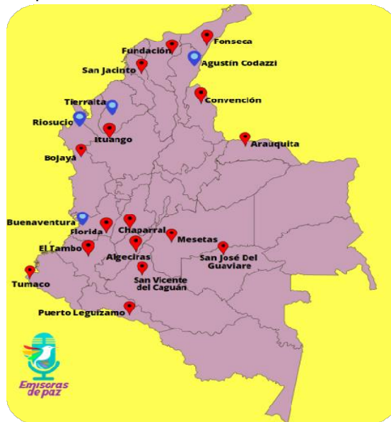
Mapa N°1. Territorialización Emisoras de Paz

se espera que la participación sea aún más amplia.