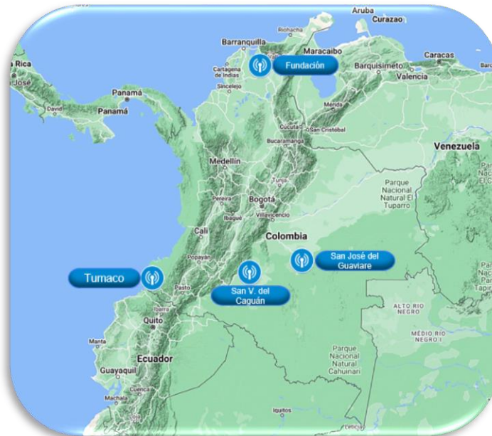
Mapa N°3. Emisoras de Paz que entraron en funcionamiento en el año 2023