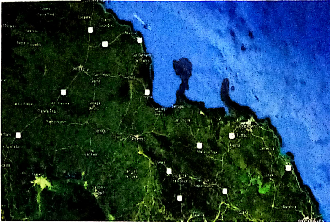
Golfo de Morrosquillo