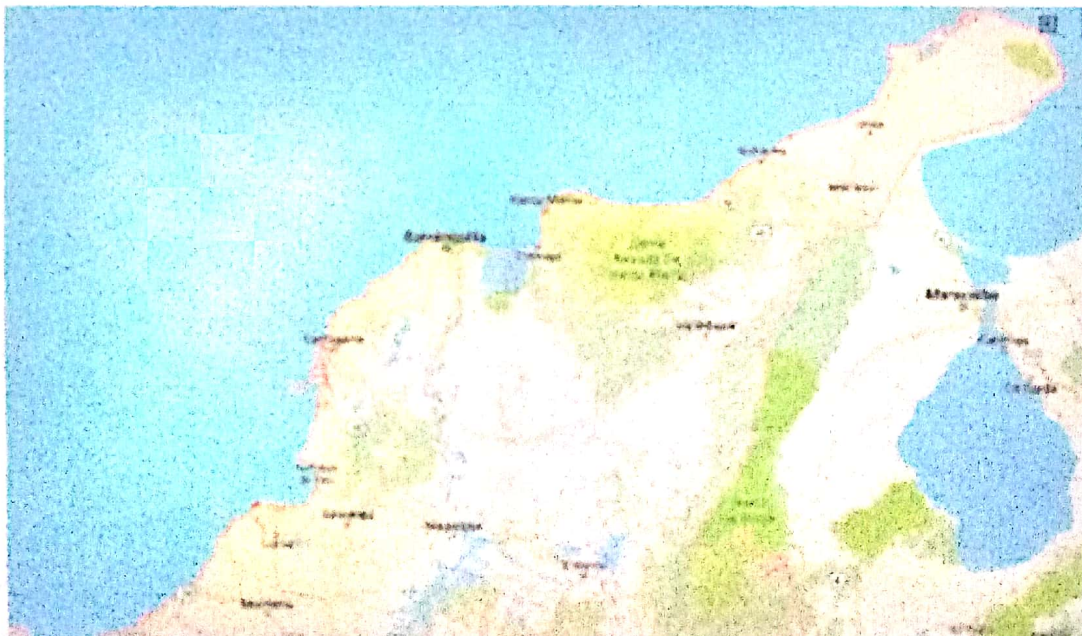
Costa Caribe Colombiana