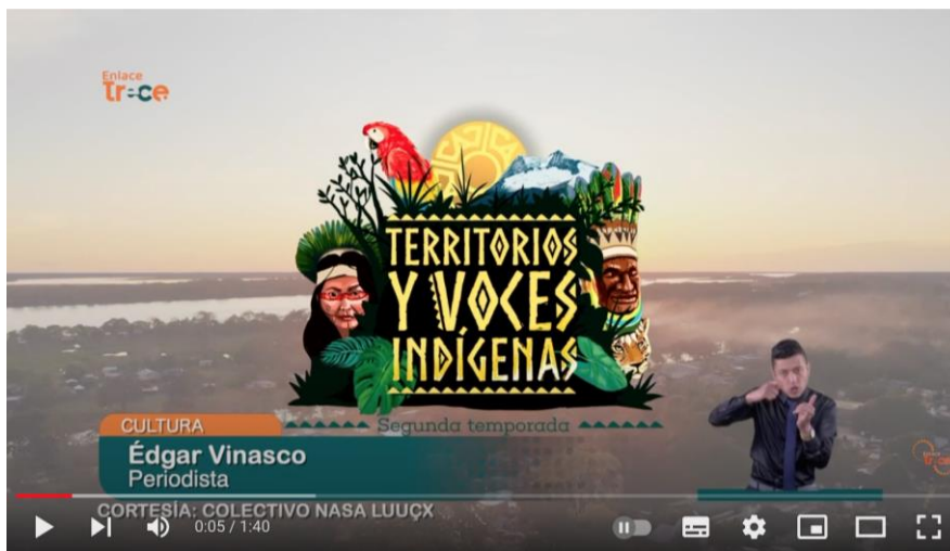
Imagen 7. Evidencia fotográfica – Serie Territorios y Voces Indígenas

La segunda temporada fue lanzada por TEVEANDINA – CANAL TRECE el 20 de noviembre de 2022 para el disfrute de las y los colombianos.