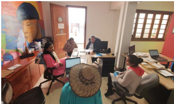
Jornada capacitación PACPI ONIC 21 de noviembre de 2022, Bogotá