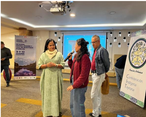
Muestra Nacional Audiovisual – Ni kuma: Somos imagen y voz de nuestros pueblos 9 y 10 de diciembre 2022. Bogotá.