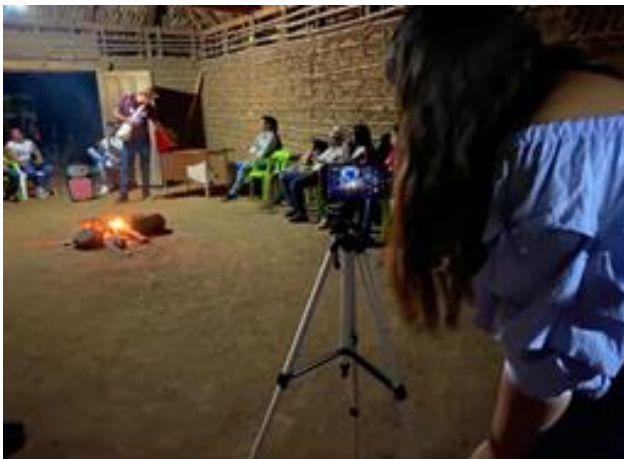
Evidencia taller Kanhuamos Ataquez, Cesar 14 de diciembre de 2022