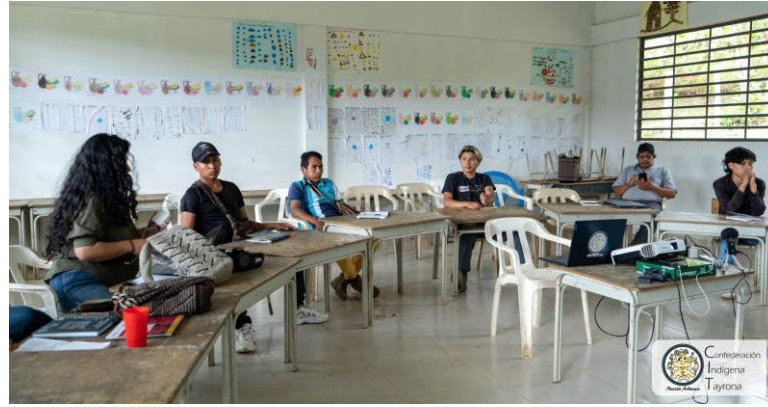
Taller MBPCI – CIT

29 de noviembre de 2022, Jewru, Sierra Nevada de Santa Marta