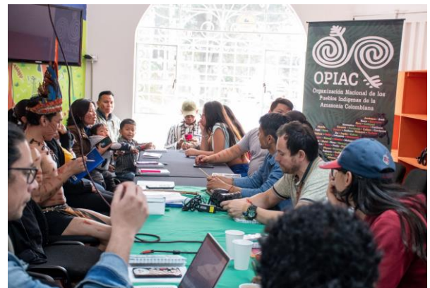
Taller MBPCI – OPIAC 20 y 21 de diciembre de 2022, Bogotá