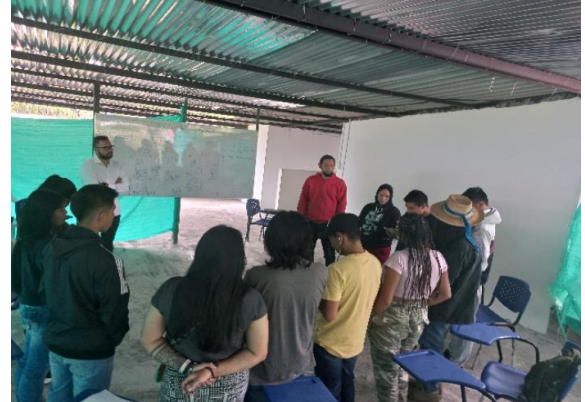
Evidencias Capacitaciones CRIDEC Caldas, 20, 21 y 22 de diciembre 2022