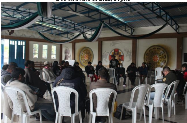
Taller MBPCI – AICO 17 de diciembre de 2022, Pasto. Nariño