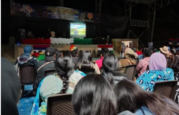
Evidencias del espacio de lanzamiento de documentales CRIHU Huila, 24 de diciembre de 2022