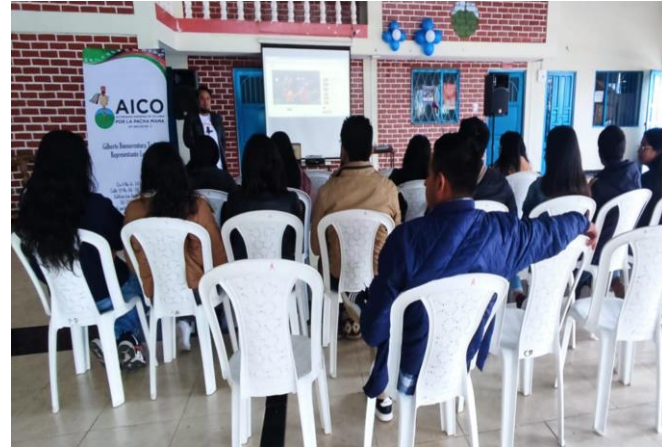
Evento circulación audiovisual AICO 6 de diciembre 2022. Resguardo Gauchucal, Nariño