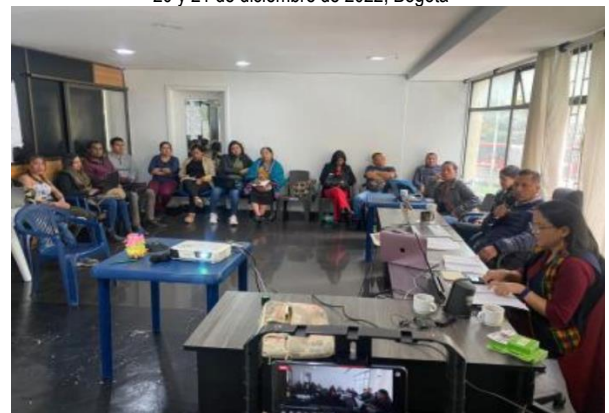
Taller MBPCI – Gobierno Mayor 18 de noviembre de 2022, Bogotá.