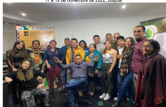
Evento exhibición – Gobierno Mayor 18 de noviembre de 2022, Bogotá.