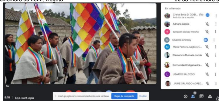
Jornada virtual capacitación PACPI – Gobierno Mayor 10 de noviembre de 2022, virtual