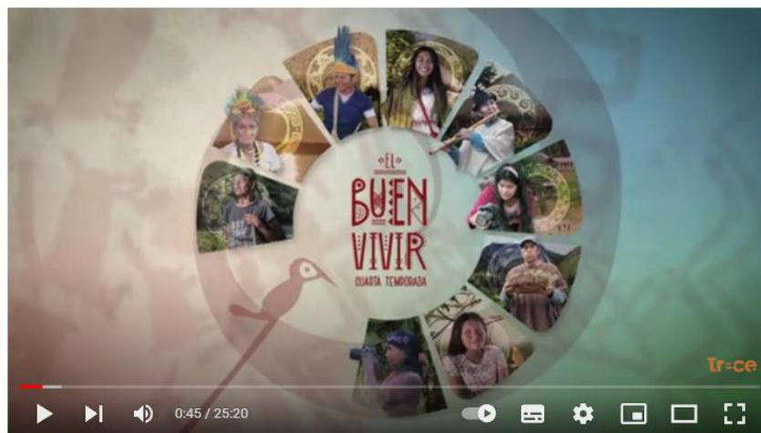
Imagen 6. Evidencia fotográfica – Serie audiovisual el Buen Vivir

https://www.youtube.com/results?search_query=buen+vivir+4+temporada