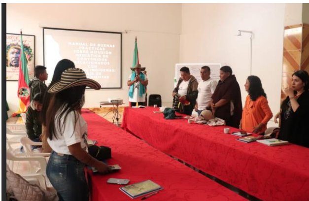
Taller MBPCI – ONIC 2 de diciembre de 2022, Bogotá