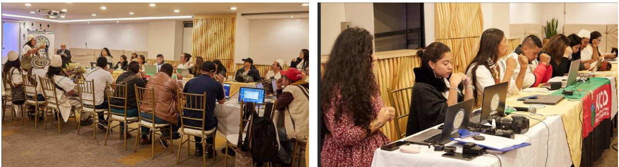
Imagen 2. sesión CONCIP 18 al 20 de noviembre de 2022