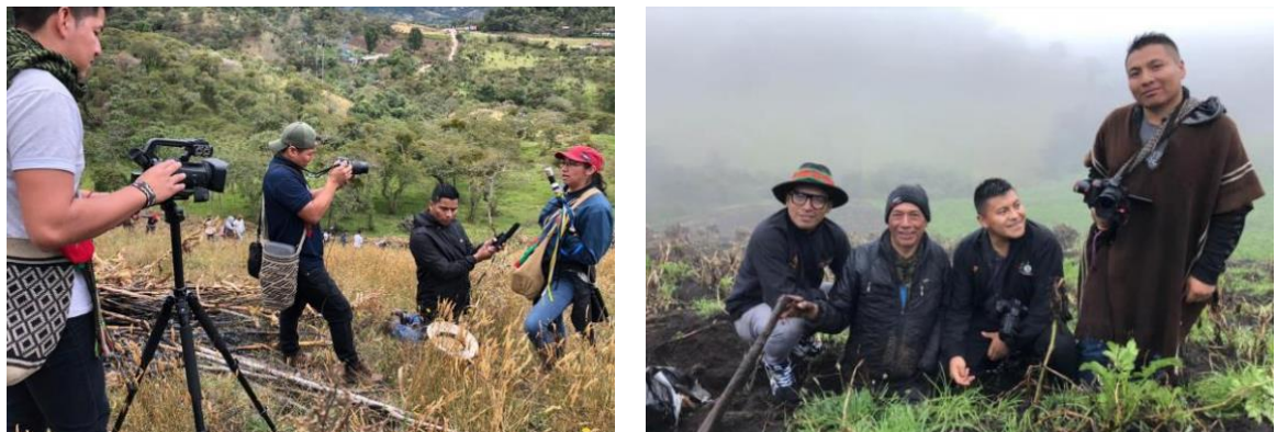
Imagen 10. Evidencia fotográfica - Proceso de formación a comunicadores CRIC