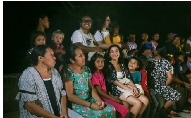
Muestra de cine wayuu – ONIC 17 a 19 de noviembre de 2022, Bogotá