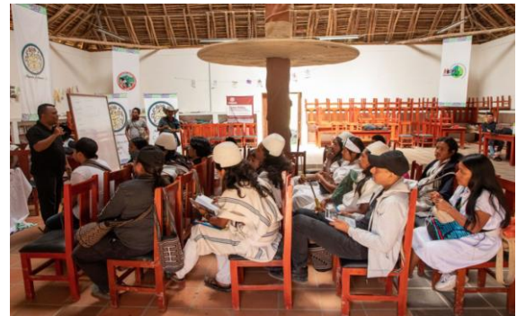
Jornada capacitación PACPI - CIT 30 de noviembre de 2022, Jewrwa