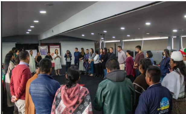
Imagen 3. Sesión CONCIP 11 y 12 de diciembre de 2022