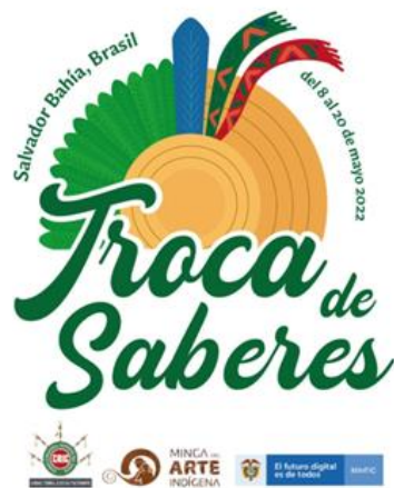
Imagen 11. Evidencia fotográfica – Intercambio de Experiencias Brasil 2022.