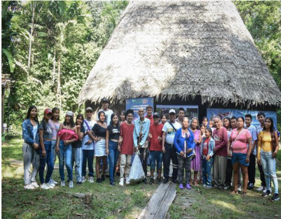
Festival de cine indígena – OPIAC 14 y 15 de diciembre de 2022, Leticia, Amazonas