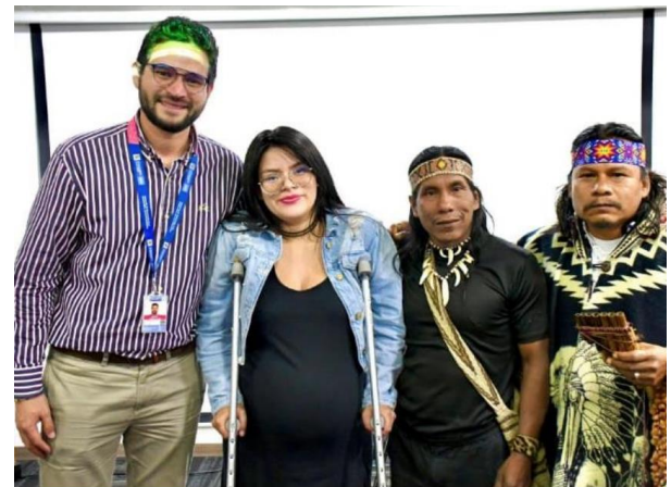
Evidencia MRA – Comunicaciones Bogotá, 1 de diciembre de 2022

Fuente: Informe convenio interadministrativo 758-2022