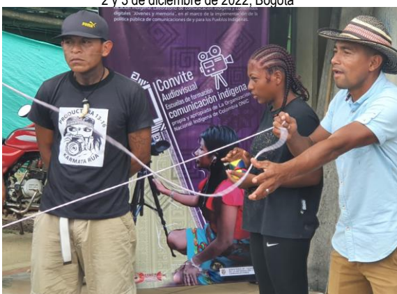
Convite audiovisual Jimbuso – ONIC 16 de diciembre de 2022, Reguardo Indígena La Palma, Apartadó Antioquia