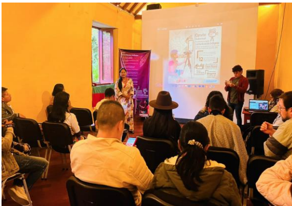
Convite audiovisual – ONIC 2 y 3 de diciembre de 2022, Bogotá