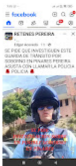
FOTOGRAFIA 15 03 2026.jpeg