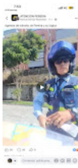
FOTOGRAFIA 1 14 03 2026.jpeg